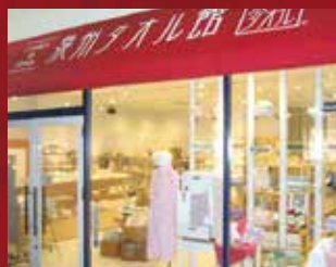
泉州タオル館 りんくうプレミアム・アウトレット店