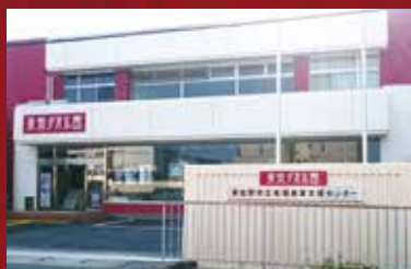
ショールーム & タオルショップ 泉州タオル館本店 (大阪タオル工業組合)