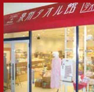
泉州タオル館 りんくうプレミアム・アウトレット店