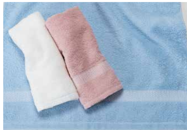
03 かるやか 【金野タオル株式会社】

甘然りにした細番手の糸をパイルに使用したタオルです。ボリューム感がありながらも軽く、とても柔らかく肌触りの良い仕上がりになっています。ボーダー部分のウーリー糸とヘム部分のラメ糸がアクセントになっています。