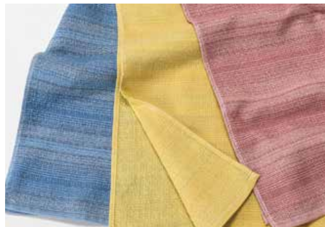
04 コンパクト 【金野タオル株式会社】

表面はガーゼ織、裏面のみパイル仕様の非常に薄手のタオルです。100cmの長さがあるため、かさばらないので、どこにでも持ち運びやすく、ランニング時などに首に巻くのがお勧めです。スレン糸でガーゼ面をグラデーションのように表現したおしゃれなタオルです。