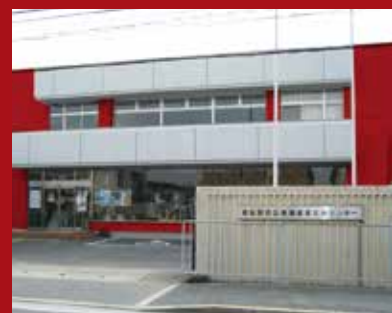
ショールーム&タオルショップ 泉州タオル館 大阪タオル工業組合