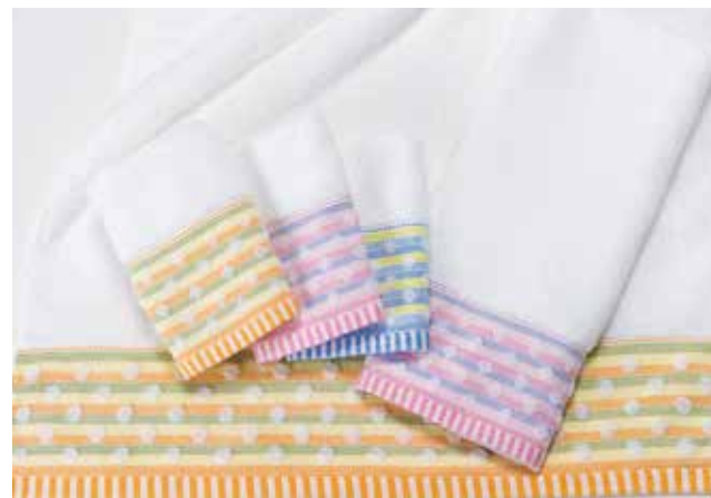
02 パステルドット 【金野タオル株式会社】

パイルに無撚糸を使用した弾力のある柔らかいタオルです。パステルカラーのスレン糸と凸凹のドットでふんわりとかわいらしく、またラメ糸がアクセントになっています。