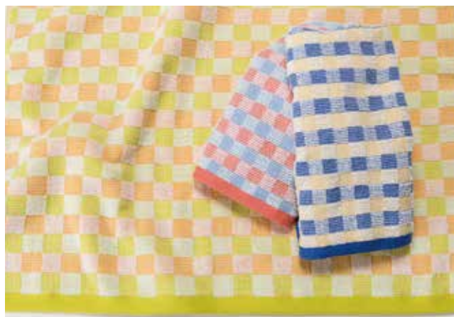
01 パステルチェック 【金野タオル株式会社】

無撚糸を使用した、ふわふわなタオルです。表面は短パイル、裏面は長パイルにしていることで異なる2つの肌触りを楽しめます。2色の色糸で可愛いチェック柄をデザインしました。