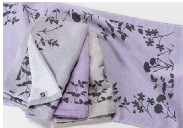
08 ニュアンス・ピュアサテンタオル2019【坂口将タオル株式会社】

タオルの表面を、昔ながらの縺子織組織に、裏面をパイルにすることでタオル生地のボリューム感と、しなやかさを両立させたタオルです。2色の色糸を組み合わせて表現した玉虫調の色彩と、リーフ柄のプリントでナチュラルなデザインタオルに仕上げました。