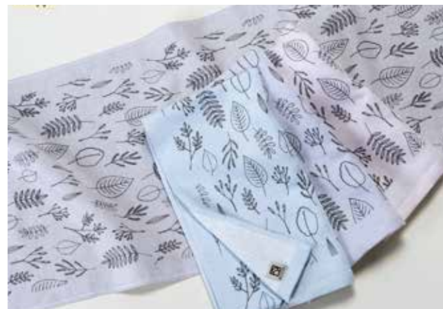
07 パイアス・ピュアサテンタオル2019 【坂口将タオル株式会社】

タオルの表面を、昔ながらの縺子織組織に、裏面をパイルにすることでタオル生地のボリューム感と、しなやかさを両立させたタオルです。色糸を使った優しい色彩とリーフ柄で、ナチュラルなデザインタオルに仕上げました。