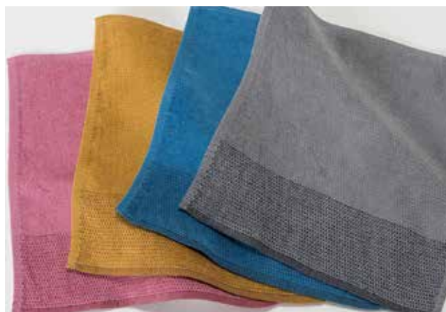
05 ビジネス綿M 【金野タオル株式会社】

モール糸を使ったタオルハンカチです。ポケットに収まる適度な厚みに仕上げました。制菌加工を施しているため、汗のにおいを抑えられます。ツー-toneカラーでコーディネートも楽しめます。