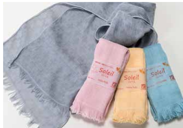
06 ソレイユ 【金野タオル株式会社】

夏用のタオルマフラーです。消臭糸タツロンαが、いやな汗のにおいを強力消臭。冷感素材が首に触れた時のひんやり感を実現しました。