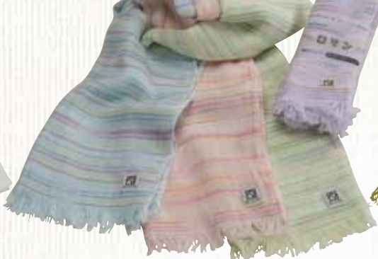
22 ロマン 【金野タオル株】

やさしいビステル調の色彩でおしゃれに仕上げました。モダール(レーヨン)を使用しているため、柔らかく吸水性に優れています。また、太陽光があたることにより、UVカットや抗菌作用を発揮する特殊な糸を織り込んでいます。