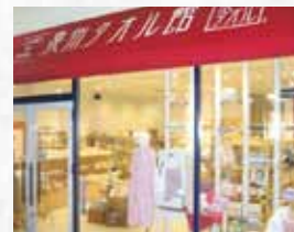
泉州タオル館 りんくうプレミアム・アウトレット店