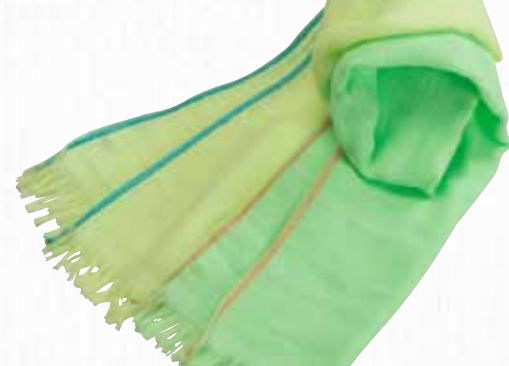
28 ルミナスカラー・コットンマフラー 【新田谷織布工場】

インディゴブルーで染めた高吸水五ツ星タオルです。手染めが主流のインディゴ染料を、工業的生産方法で可能にし、独特の色合いと、極めて高い吸水性を両立させています。表裏パイルタオルと、変わりガーゼ織りタイプの2種類をご用意しました。