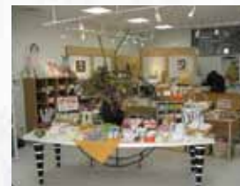
タオルショップ 泉州タオル館 泉佐野駅前店