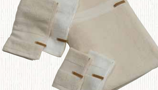
30 WHITE & NATURAL ベア40タオルシリーズ 【美由喜タオル株】

へ通しを新設計し、パイル立ちが良くなるようにしています。同時に、織物の交差点を多く取れるので、目押しにくくなっています。また、特別な糸を使用するのではなく、番手選定と撚りで柔らかさを出しています。さらに酵素加工で仕上げたり、漂白も過酸化水素水の漂白にし、エコマーク取得予定です。