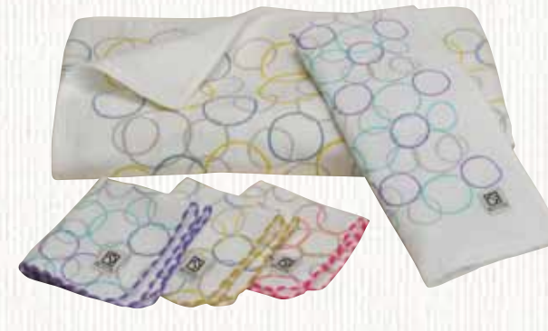
21 ムース 【金野タオル株】

表を柔らかく風合いのガーゼ織りで、裏をふわふわの無蒸糸パイルで織り上げた、とても軽くて柔らかいタオルです。無蛍光の生地、水中に浮かぶたくさんの泡のイメージを表現しました。