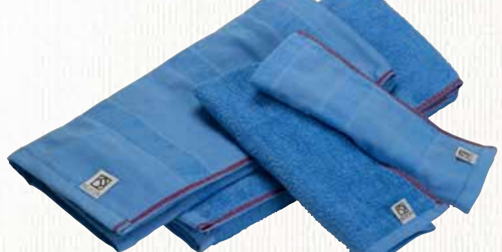
29 ジーンズカラー五ツ星タオルシリーズ 【新田谷織布工場】

インディゴブルーで染めた高吸水五ツ星タオルです。手染めが主流のインディゴ染料を、工業的生産方法で可能にし、独特の色合いと、極めて高い吸水性を両立させています。表裏パイルタオルと、変わりガーゼ織りタイプの2種類をご用意しました。