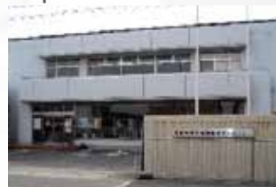
ショールーム&タオルショップ 泉州タオル館 大阪タオル工業組合