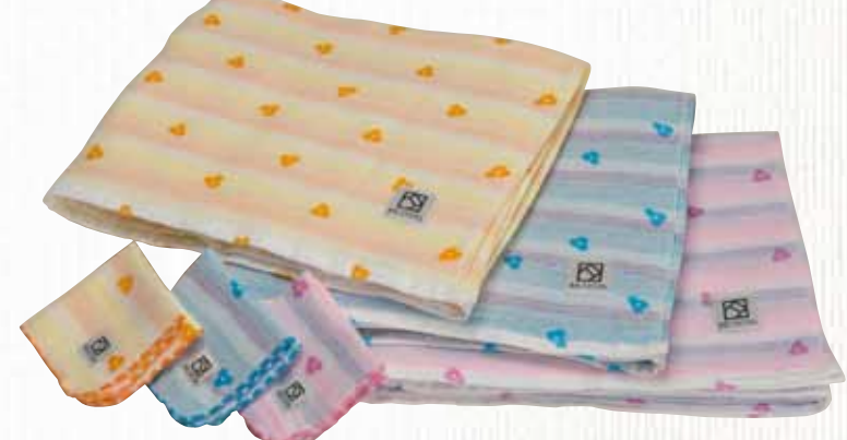
26 はなぼーろ 【金野タオル株】

4重ガーゼ織のおくるみとハンカチをつくりました。肌に触れる表面には、抗菌作用のあるクラリオンを織り込み、中面2段に撥水性に優れたアクリルの色糸をグラデーションにして包み込み、同系色の小花プリントを散りばめました。