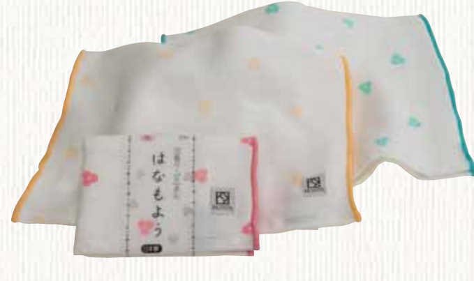
19 はなもよう 【金野タオル株】

表面に抗菌抗臭・消臭機能を持った機能糸を織り込んだふきんです。4重ガーゼなので、通常のパイルのものより吸水性・速乾性に優れています。4つ折りにすればちょうど手に収まる使いやすいサイズです。