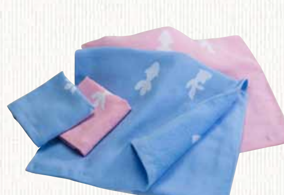
27 和染め金魚 【山野タオル工場】

国産紡績糸100%使用し、天然糊(コーンスターチ)を100%使用することでエコにこだわり、織り上げた後に泉州伝統技法「防染」(ぼうせん)で金魚を描きました。グリーンタオル生産倶楽部の工程を順守し、柔らかさと吸水性を兼ね備えた使いやすいタオルに仕上げました。