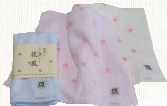
20 花風 【金野タオル株】

通常のタオルに使う半分の手巾の、細い糸を使って織り上げたカラー擦染タオルです。繊細な糸の効果で、軽くて、しなやかで、ふわふわの極上な風合いに仕上げました。