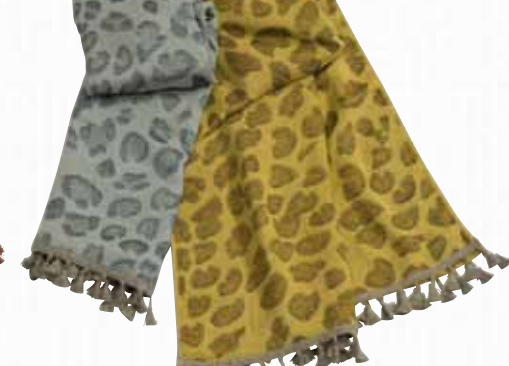
24 レパード 【金野タオル株】

あつたが繊維「サーモギア」を織り込んだ秋用ストールです。流行の豹柄をモチーフに個性的なイエローと落ち着いたグレーの2色展開。モダールを使用していますので、柔らかく肌なじみです。お洗濯時はネットをご使用下さい。