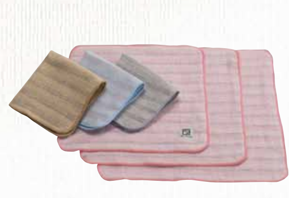
25 ビジネス綿(メン) 【金野タオル株】

表面に抗菌防臭・消臭機能を持った機能糸を織り込み、中2段には、スレンの色糸を織り込んだ4重ガーゼのタオルハンカチです。通常のパイルのものより吸水性・速乾性に優れています。ビジネスマン・ビジネスウーマンに使っていただきたいハンカチです。