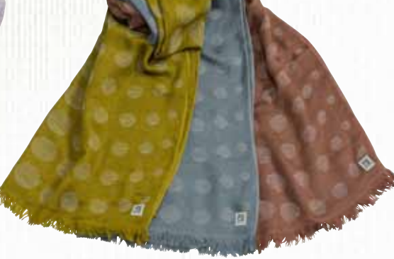
23 グランベチカ 【金野タオル株】

細くて軽い糸で織り上げたふわふわなストールです。モダール(レーヨン)を使用し、柔らかく、吸水性に優れています。太陽光があたることでUVカット・抗菌消臭効果のある糸と、発熱効果(+2度)・静電気防止の機能を持った糸の2種類の機能糸を織り込み、首元を紫外線から守り、赤外線を吸収して熱に変える暖かさも持ち合わせた機能的なストールです。