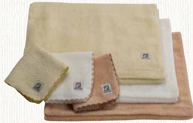
18 ナイル 【金野タオル株】

ボリューム感を狙い、若干丈めの超長綿のエジプト綿糸を高密度に織り上げ、やわらかくしなやかに仕上げました。パイルの糸を甘擦りにしてありますが、毛羽落ちは通常の10分の1程度になっています。シンブルなボーダー柄とナチュラルな色合いで高級感を演出しました。オフホワイト・アイボリー・ベージュの3配色の展開です。