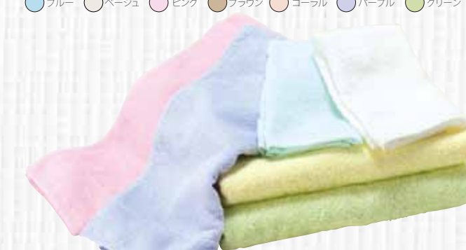
ツバメタオル株式会社 Cutie World 05 Organic Shine

インドのオーガニックコットン農家と独自開発した、オリジナルの細番手オーガニックコットンをパイル部分に使用し、オーガニックコットン100%のタオルを作りました。細い糸を使う事でしなやかで柔らかく、肌触りの良いタオルに仕上がります。また肌触りが良いだけでなく軽く乾きやすい大変使いやすいタオルとなりました。環境に優しい有機精練加工を施し染色を食品添加物に指定されている食用色素にすることで「食べられるくらい安心・安全なタオル」が完成しました。デザインアクセントに銀糸のステッチを施しリッチ感を演出しています。