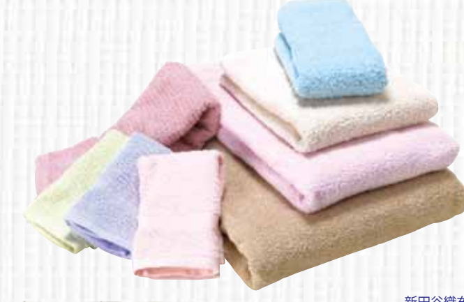
新田谷織布工場 Cutie World 02 高吸収五つ星カラータオルシリーズ

タオル格付協議会の認定基準で吸水性五つ星の認定を受けた後染めカラータオルアイテムです。高級綿糸を使用し、精練漂白染色工程での独自のレサイブを指定し、今までより時間と手間をかけて丁寧に製造することで、高吸水性能を安定確保しています。吸水剤を使用するのではなく、綿(コットン)の持っている本来の機能を引き出すことで高吸水性能を実現しています。