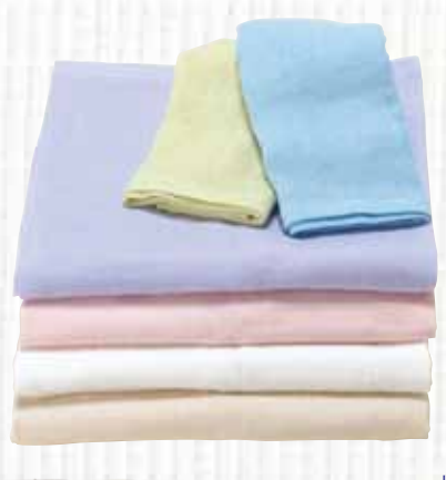
山野タオル工場 Cutie World 03 銀(ミューファン)抗菌ガーゼタオル

国産紡績糸を100%使用し、製造工程において使用する糊を、天然糊(コーンスターチ)を100%使用することにより環境と人への安全・安心に配慮しました。さらに、抗菌効果の高い「ミューファン」(銀ラメ糸)を織り込むことでベビー(乳児)にも安全な抗菌・防臭機能を付加しました。