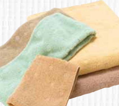
ツバメタオル株式会社 Cutie World 06 Organic Cutie

インドのオーガニックコットン農家と独自開発したオリジナルオーガニックコットンを100%使用し、オーガニックコットン本来のしっかりとした使用感を味わって頂けるボリューム感に仕上げました。環境に優しい有機精練加工をベースに、染色にも飲料用(コーヒー、紅茶、緑茶、麦芽、ココア)として作られた製品を利用するなど、糸にも加工にもこだわることによって可能なエコ加工を施しています。体にも環境にもとことん優しいタオルを作りました。水玉模様をジャカード織り表現した、優しいイメージの商品は贈り物にも最適な商品です。