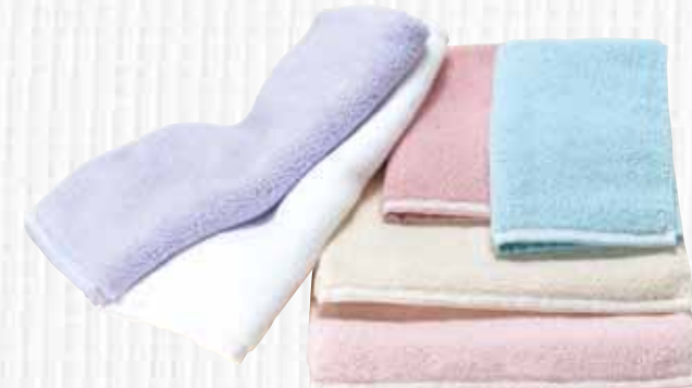
株式会社松藤テリー Cutie World 04 泉州の華織

サイズを見直し、アイテムごとの使用シーンに合わせ、コンパクト化することで“使い易く”し、ボリュームを与えることでドライユースタオルとしての“品質と使用感を高め、耐洗濯性を良好にした極めて「優しくソフト」なタオルが完成しました。