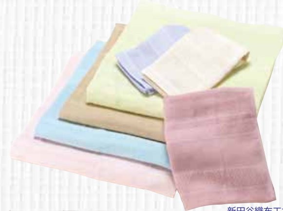
新田谷織布工場 Cutie World 01 ダブルフェース

■「こだわりの綿糸」…原料の綿花が持っている綿本来の性格や本質(バルキー性・柔らかさ・吸水性の良さ)を最大限に引き出す事のできる後晒タオルだからこそ、素材にもこだわりました。泉州の後晒タオルに最適な綿を厳選し、吸水性、乾きの良さ、光沢感、毛羽落ちの少ない、綿本来の柔らかな肌触りなど、「安心・安全」なプレミアムのための素材を使用しています。